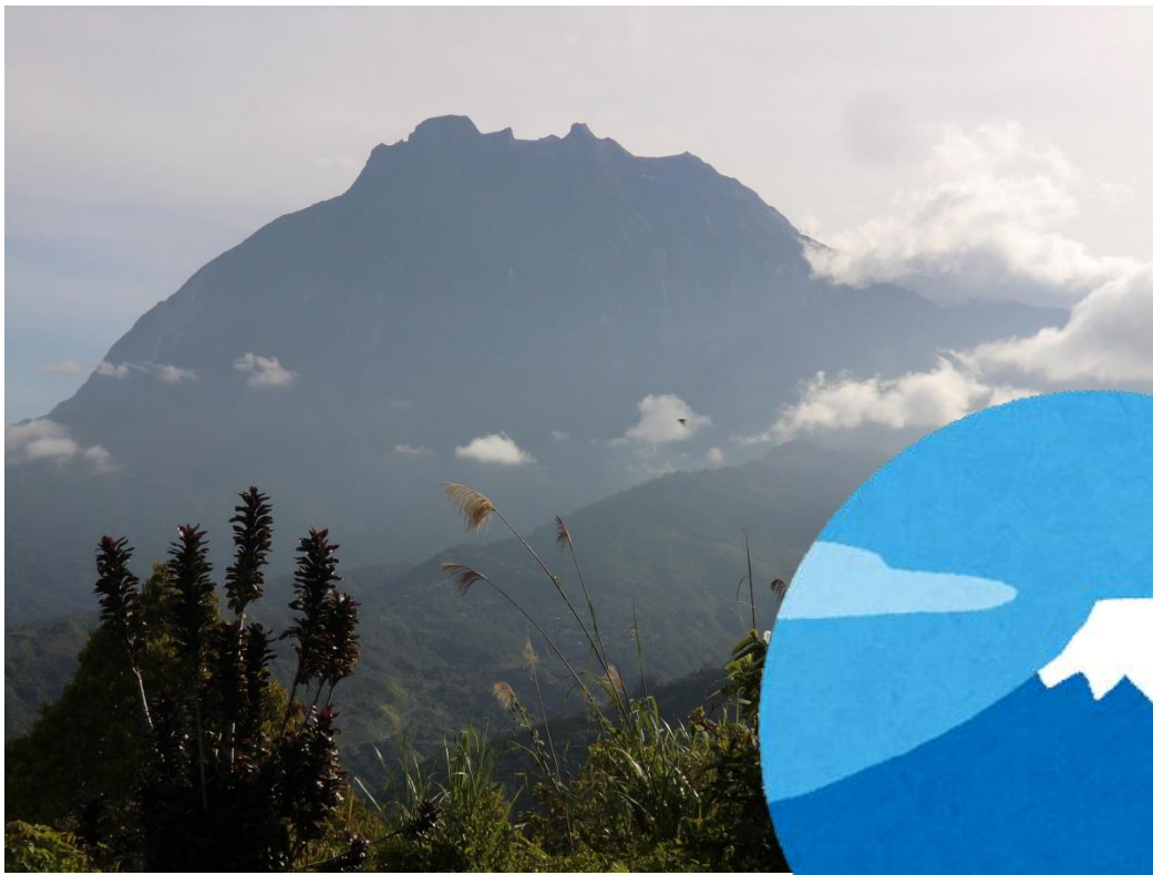
きなばるさん キナバル山